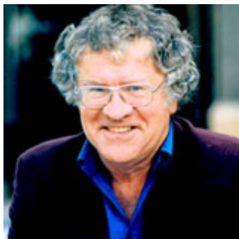
• Ian Gibson (España, Irlanda) Hispanista internacionalmente reconocido. Tras la publicación de su biografía de Rubén Darío fue elegido miembro de la Academia Nicaragüense de la Lengua Española.