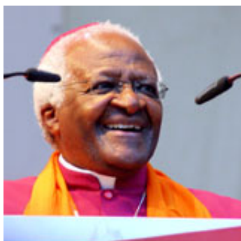
• Desmond Tutu (Sudáfrica)