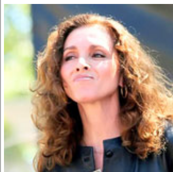
• Ana Belén (España)

Entre las que destacamos las adhesiones siguientes: