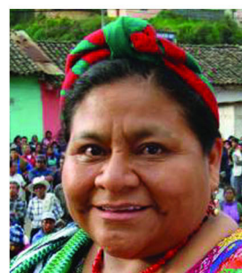
Rigoberta Menchú Tum 危地马拉 诺贝尔奖获得者

1971年，他执行阿波罗14号任务，成功登陆月球，改变了他人的人生经历，他也从此闻名。他是思维科学机构的创始人，发起了对意识性质的研究。他说：“我支持为和平与非暴力的世界游行，它的努力将唤醒政府和全世界人民的意识，共同为消除战争，侵占和各种形式的暴力活动而奋斗。”