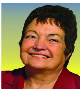
Mairead C. Maguire 英国 诺贝尔奖获得者

她是北爱尔兰人类和平团体的共同创始人，也共同组织过一次3.5万人在贝尔法斯特街道上的游行。她相信消除暴力最有效的方法是再教育。在1976年获得诺贝尔奖以后，她以一名女性诺贝尔和平奖获得者的身份继续工作，并一直设法消除以色列和巴基斯坦之间的暴力战争。