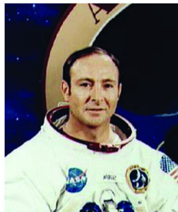
Edgar Mitchell 美国 宇航员

她曾是新西兰工党政府成员，此政府将和平做为一门学科引入学校课程，禁止核武器，她当选总理后，发起了全球和平教育运动。她同时是核裁军和防止核扩散法规专家组和世界女领导人理事会的名誉会员，她目前正在领导联合国发展项目。