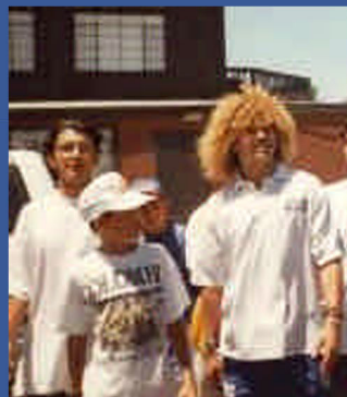
卡洛斯-巴尔德拉马. 运动员 哥伦比亚 体育界

曾就读于拉普拉塔国立大学的费尔南德斯是一位律师，并且是阿根廷的现任总统。她认同正义运动，并投身于人权奋斗事业。她是现任的阿根廷共和国总统，并在各种场合进行公开演讲。她说：“我给为和平与非暴力的世界游行发送了一条专门的支持简讯。简讯的内容主要表达了我们必须为建立一个没有暴力的世界而时时奋斗的决心，我们要举起正义、自由、对话、机会平等和每个人的尊严必须受到尊重的旗帜。让游行把来自于各个国家的人们聚集在一起，共同为了和平与自由而奋斗。”