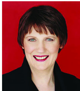
Helen Clark 新西兰 政府人员

她是北爱尔兰人类和平团体的共同创始人，也共同组织过一次3.5万人在贝尔法斯特街道上的游行。她相信消除暴力最有效的方法是再教育。在1976年获得诺贝尔奖以后，她以一名女性诺贝尔和平奖获得者的身份继续工作，并一直设法消除以色列和巴基斯坦之间的暴力战争。