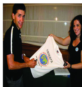
Carlos Sastre 西班牙 运动员

来自于K'iche-Maya本土组织的Rigoberta Menchú Tum博士在1992年被授予诺贝尔和平奖。她说“我要为那些世界各地为和平而贡献自己一份力量的所有朋友们，送上一份特别的问候。首先，我想号召年轻人来参与这项为和平而进行的运动，可以让他们通过参加像这样的全球活动而使世界变得更美好。”