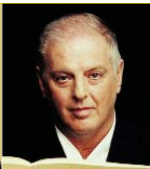
Daniel Barenboim ALLEMAGNE MUSIQUE

de promotion de la MM. Les communautés représentées étaient : Australie, Kenya, Cuba, Philippines, Pologne, Mexique, Inde, Ghana, Russie, Inde, Angola et Thaïlande. S'y sont joints des