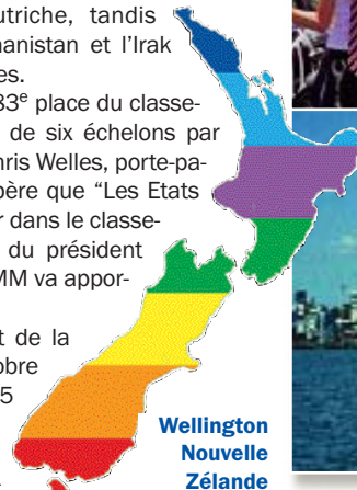
Wellington Nouvelle Zélande