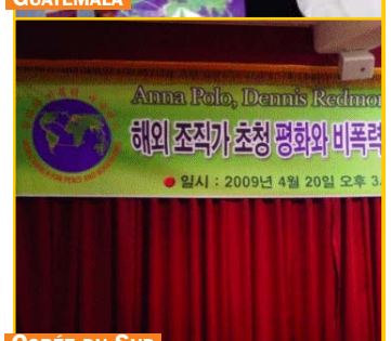
CORÉE DU SUD