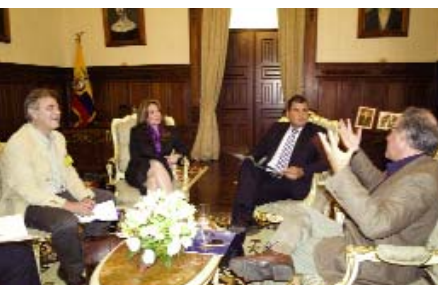
Correa, de la Rubia et Hirsch

La réunion s'est déroulée avec légèreté et humour et s'est terminée sur la terrasse face à la Plaza Grande à Quito, d'où les gens ont spontanément salué le Président, avec vivacité, démontrant ainsi l'affection qu'ils lui portent.