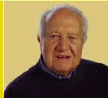
Mario Soares PORTUGAL POLITIQUE