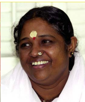
Amma INDE RELIGION & SPIRITUALITÉ

Fondateur de l'Académie irakienne d'art. Artiste irakien très impliqué dans la Non-violence. « Si une personne ne peut aimer, elle finira par détester. Ne pas fermer les yeux face à la pauvreté, la guerre, l'exploitation et l'injustice est une question de responsabilité humaine. »