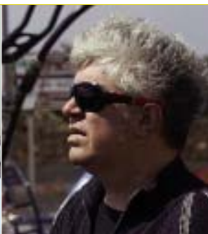
Pedro Almodovar ESPAGNE CINÉMA

Le 1 er Imam de la Mosquée Faycal de Conakry, le plus grand représentant musulman de la Guinée, a adhéré à la MM. « Ce Mouvement pour la paix a besoin de tout le soutien possible, par conséquent je m'engage et j'adhère à la MM. Pour tout développement, tout progrès culturel, l'acquisition de la paix est nécessaire. En ce sens, nous nous considérons comme l'un des pionniers de la paix en Afrique. Nous croyons que la paix doit être appliquée dans tous les aspects de la vie. »