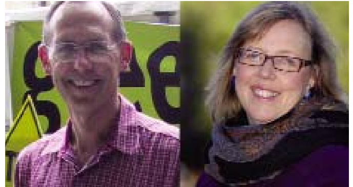
Bob Brown et Elizabeth May

Parallèlement à ces adhésions, nous avons reçu le soutien de l'ensemble du Parti Vert de Suède de même que celui du